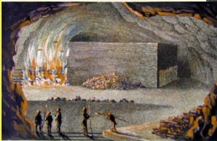
Vue sur un bûcher en feu (le feu du malin).

Charles LAN - Mémoire sur l'exploitation par le feu de la mine de Ramsberg 1830