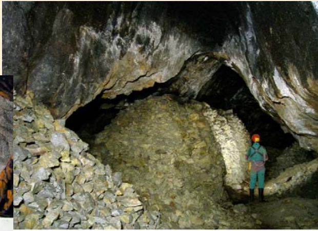
Piliers de remblais modernes dans les chantiers souterrains médiévaux - B. ANCEL 2009

Charles LAN - Mémoire sur l'exploitation par le feu de la mine de Ramsberg 1830