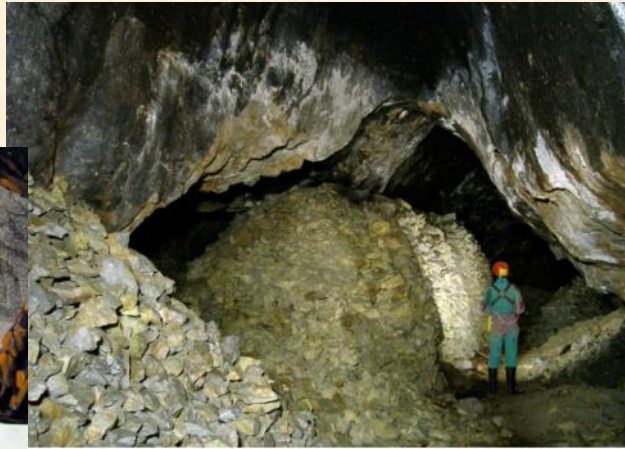
Piliers de remblais modernes dans les chantiers voûtés médiévaux - B. ANCEL 2009

Charles LAM - Mémoire sur l'exploitation par le feu de la mine de Rammelsberg 1830