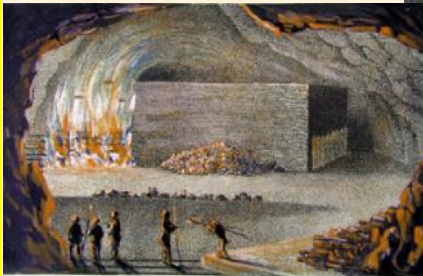
Nur Bay Buecher en feu (le boudé malin).

Charles LAM - Mémoire sur l'exploitation par le feu de la mine de Rammelsberg 1830