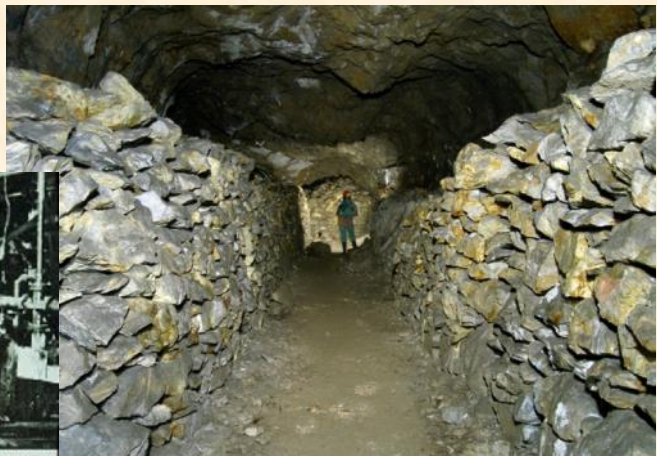
Passage bordé de remblais dans un chantier du niveau Saraceni - B. ANCEL 2009